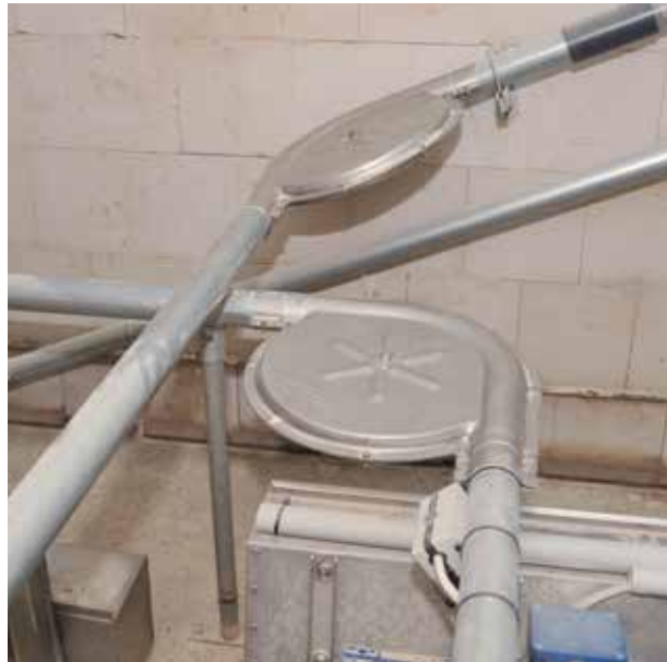
Umlenkecke aus Edelstahl