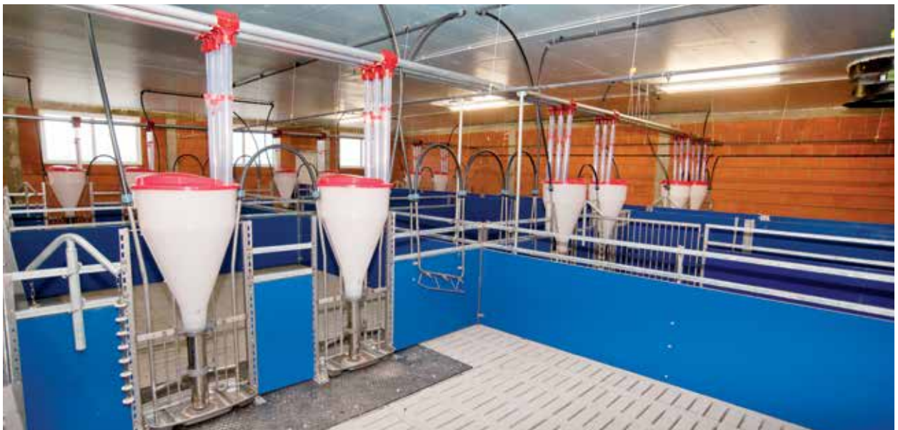
Mehrsortenfütterung im Maststall