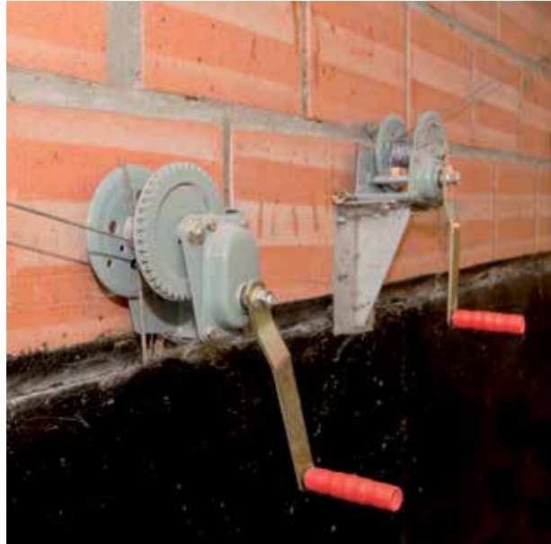
Manueller Auslösemechanismus für Volumendosierer