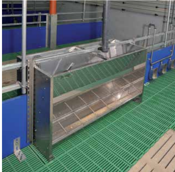
Trockenfutter-Doppelautomat aus Edelstahl mit 2x7 Fressplätzen