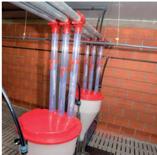
Stufenlos verstellbares Teleskop-Fallrohr