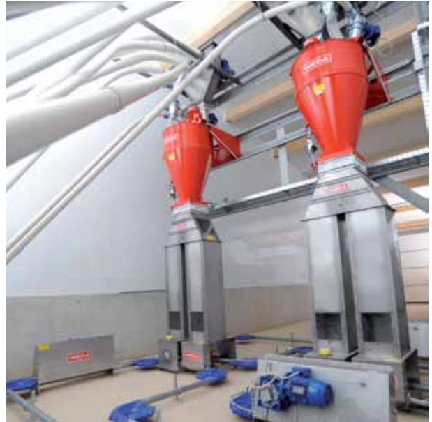
DryComp-Anlage mit Parallelablauf