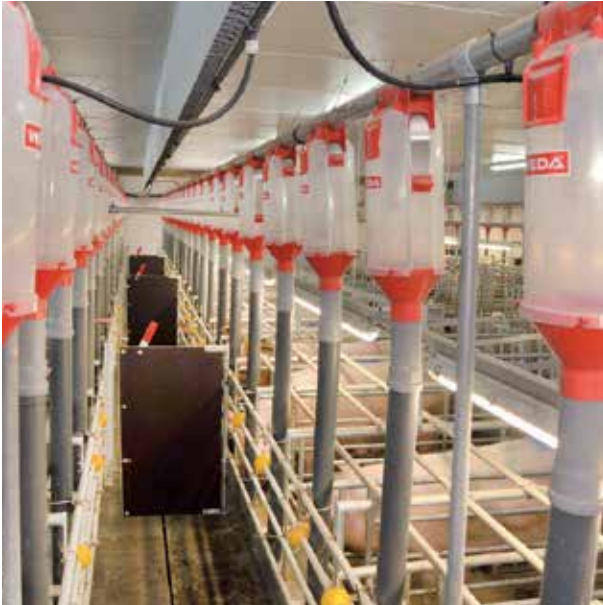
Volumendosierer für eine Futterlinie