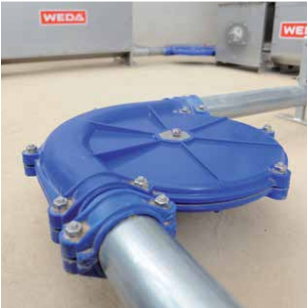
Umlenkecke aus Kunststoff

Kommen Sie sicher um die Kurve. Umlenk-Ecken führen Ketten über ein Laufrad und ermöglichen den problemlosen Transport über Eck. Die integrierten Laufräder vermindern den Verschleiß und sorgen für ein langes Leben der Kette.