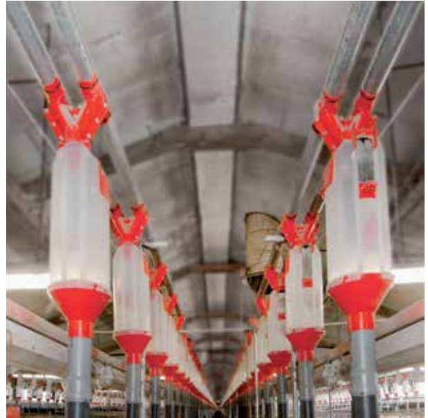
Volumendosierer für zwei Futterlinien