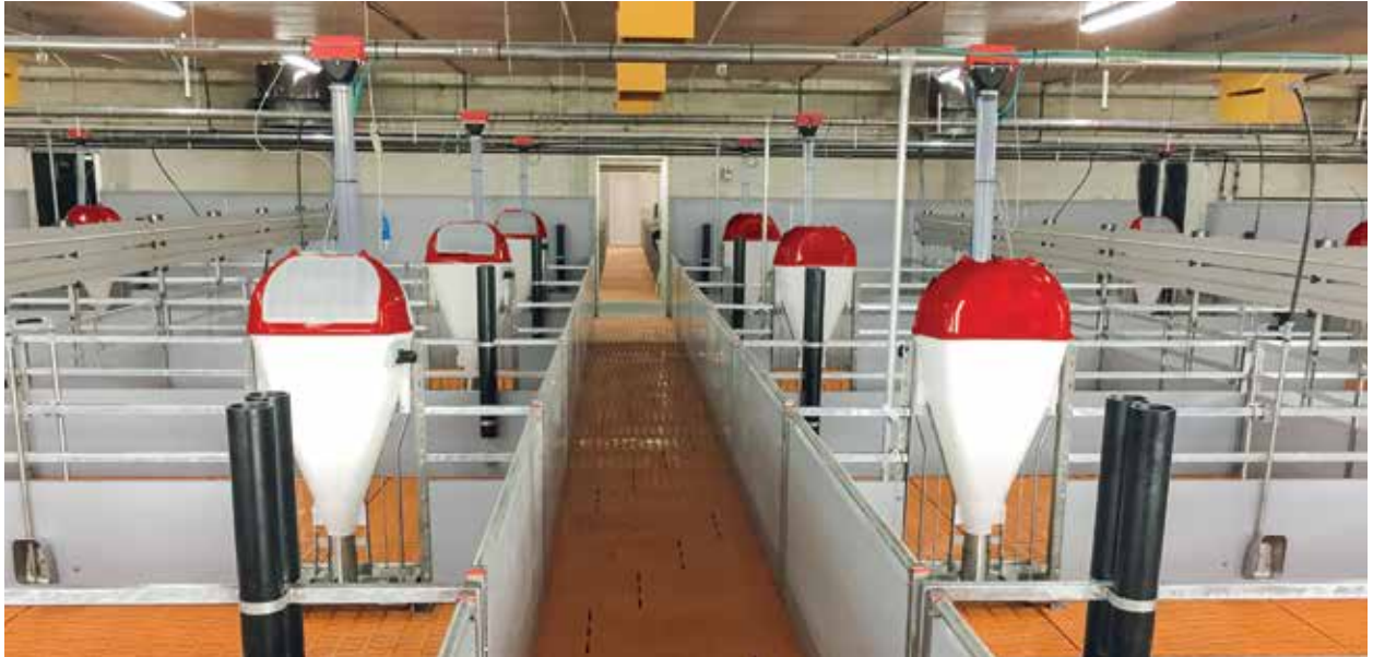
Trockenfütterung mit Classic Feedern im Ferkelstall