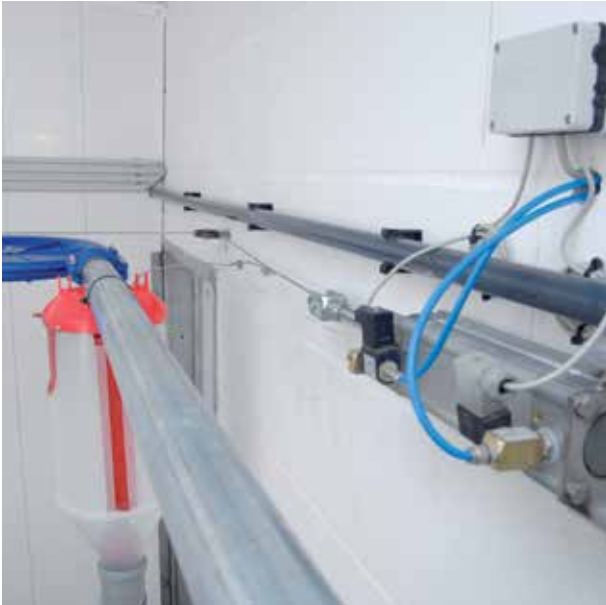
Automatischer Auslösemechanismus (pneumatisch) für Volumendosierer

Trockenkomponenten sicher ausdosiert. Mit unseren Produkten gelangt das Trockenfutter sicher zu Ihren Tieren, angefangen bei den Ausläufen bis hin zum Volumendosierer.