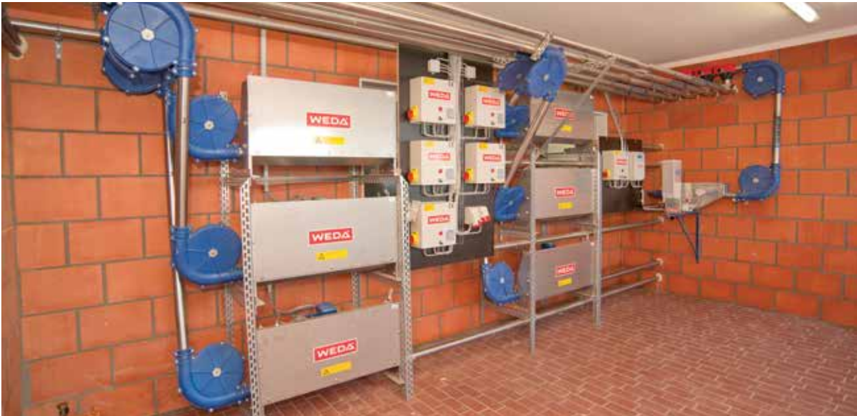
Steuerungszentrale Trockenfütterungsanlage mit 6 Futterlinien

Sicher, zuverlässig, langlebig. Unsere Produkte für die Trockenfütterung überzeugen durch sichere Technik und einfache Bedienung. Mit unseren zuverlässigen Steuereinheiten und hochwertigen Silos bleiben keine Wünsche offen.