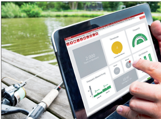
Bild 3: Das Dashboard ermöglicht es Schweinehaltern die Anlage immer im Blick zu haben.